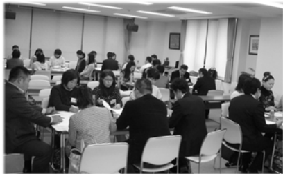
2月6日合同委員会 (於：私学会館)